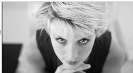
SPECIFIEKE KENNIS Special Topics & Short Formats